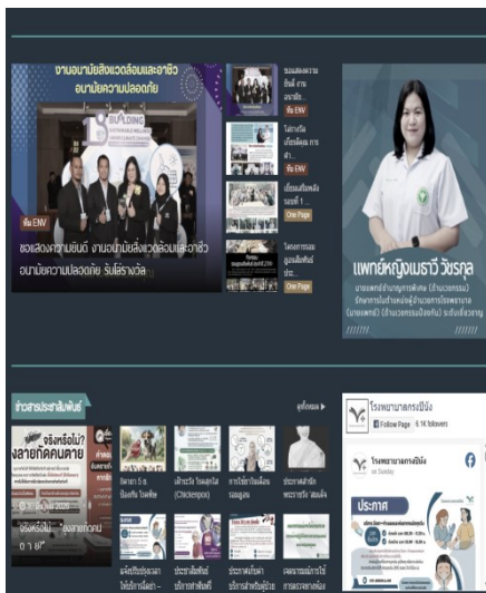
Web site ของโรงพยาบาล