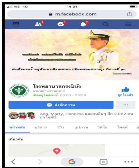
Face book รพ.