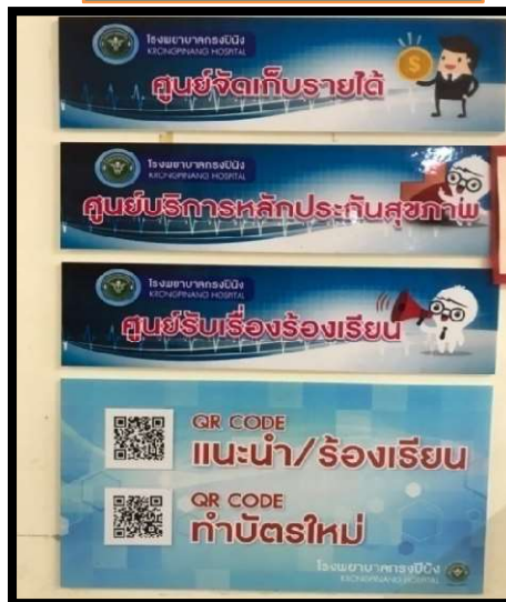
ศูนย์รับเรื่องร้องเรียน