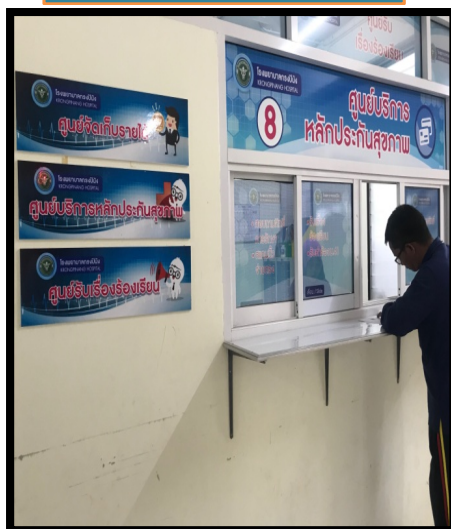
ร้องเรียนด้วยตนเอง